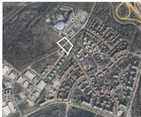
Légi felvétel a területről 2024-ben (módosítási javaslattal érintett ingatlan fehér kontúrral jelölve)

A módosítás a kialakult állapothoz képest új beépítési volument nem tesz lehetővé, a módosítás célja a kialakítható rendeltetési kör változtatása (új lakások lehetővé tétele). A módosítás során ennek megfelelően a beépítési sűrűségnek és a zöldfelületi átlagértéknek való megfelelés igazolása nem szükséges.