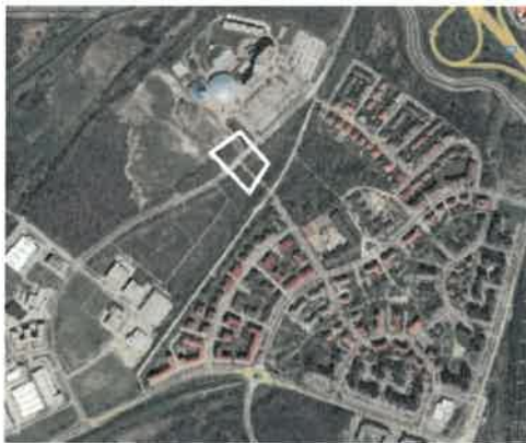
Légi felvétel a területről 2013-ban (módosítási javaslattal érintett ingatlan fehér kontúrral jelölve)

A KÉSZ módosítás célja az aktuális piaci igényekhez igazodóan még több lakás elhelyezésének lehetővé tétele a területen. Az ingatlan és annak környezete az elmúlt 10 évben épült be, lakódomináns rendeltetésekkel. A területen az intézményi vegyes besorolással ellentétesen leginkább monofunkciós társasházak épültek. Az elmúlt két népszámlálás közötti időszakban a KSH adatai alapján a lakónépesség ezen az újonnan beépült területen közel 600 fővel növekedett, alapellátó rendeltetések létesítése nélkül. A városfejlesztési célok megvalósításának érdekében javasoljuk a területen a KÉSZ előírásainak felülvizsgálatát az újonnan épülő lakórendeltetések alapellátását biztosító ellátó rendeltetések kialakításának érdekében szükséges területbiztosításokkal.