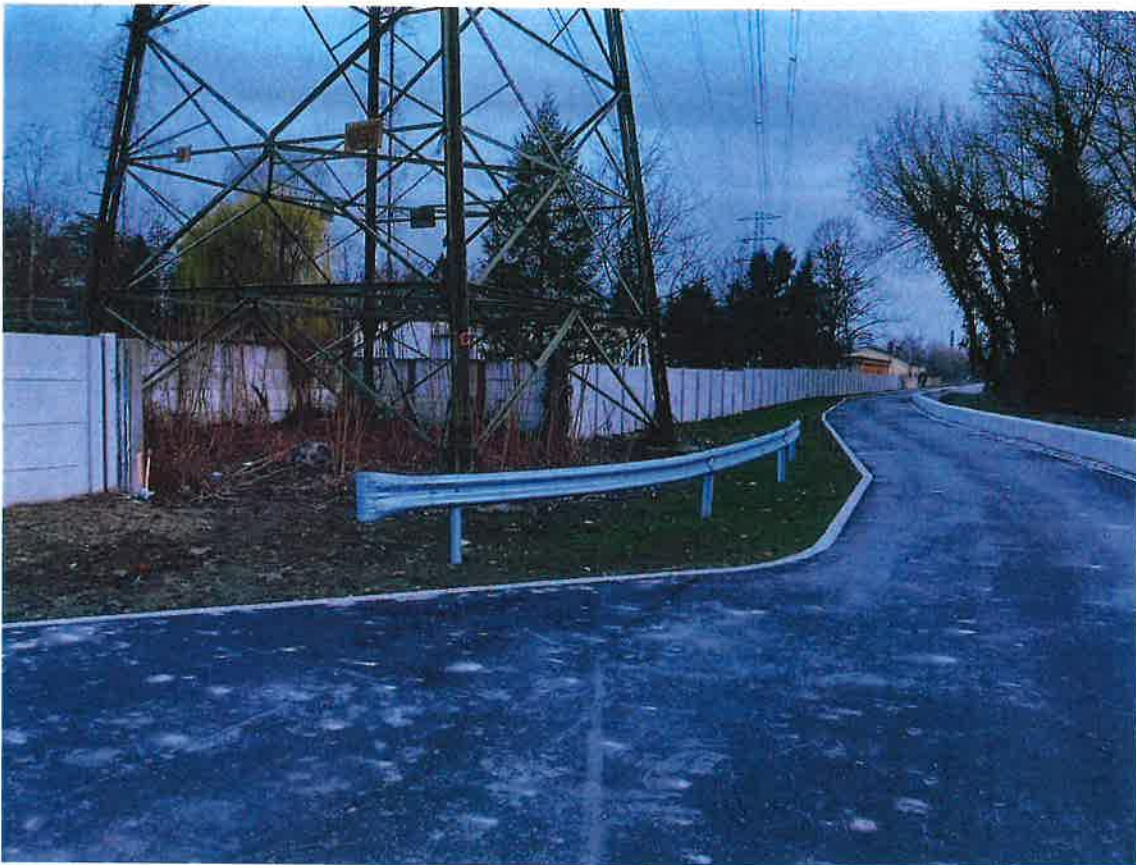
7. ábra Csereingatlan mögött önkormányzati terület árvízvédelmi gát része

A csereszerződés megkötésének több előfeltétele van, így a folyamatban lévő egész Duna-partot érintő Budapest Főváros Önkormányzata Közgyűlésének a IV. kerület, Újpest Duna-parti területére vonatkozó Duna-parti építési szabályzatról szóló 33/2018. (X. 30.) önkormányzati rendelet (a továbbiakban: DÉSZ) és a Budapest Főváros IV. kerület Újpest Önkormányzat Képviselő-testületének Újpest Dunapart területére vonatkozó kerületi építési szabályzatról szóló 23/2018. (X.3.) önkormányzati rendelet (a továbbiakban: DKÉSZ) (a továbbiakban DÉSZ és DKÉSZ együtt: hatályos szabályozási tervek) módosításának elfogadása és hatályba lépése, ezzel a településrendezési tervek módosítása, tekintettel arra, hogy a Csereingatlant érintő hatályos szabályozási tervek szerinti kötelező szabályozási vonal helyének is változnia kell az árvízvédelmi töltés tervezett magasítására és az Eurovelo 6 kerékpárút tervezett nyomvonalára tekintettel (továbbá a jelenlegi telekhatár az épületeken keresztül vezet), valamint további feltétel a telekhatárrendezési vázrajz ingatlan-nyilvántartási hatóság általi záradékolása, engedélyezése is.