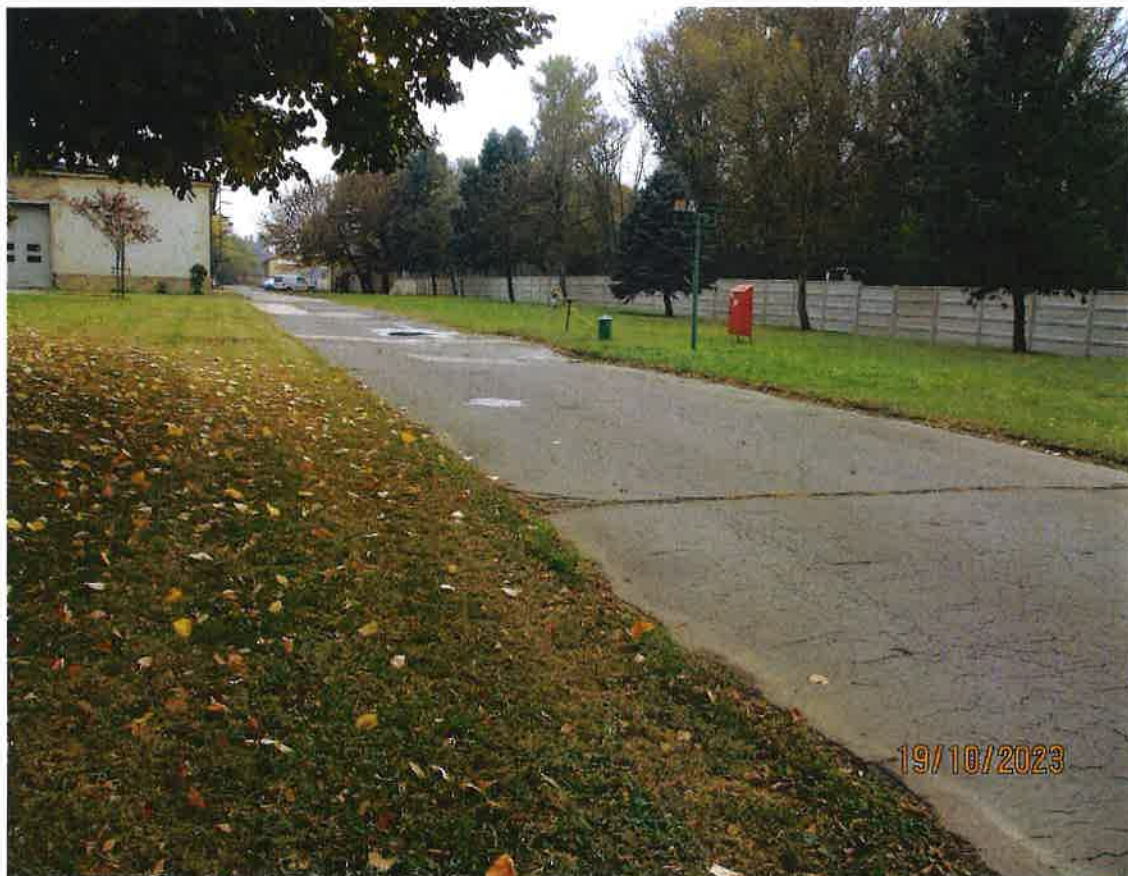
6. ábra: A Csereingatlan északi fele