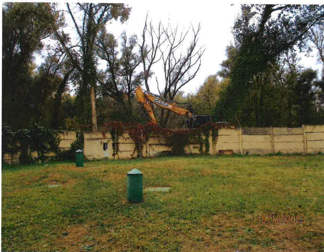
3. ábra: A Csereingatlan déli része a kerítésen belül