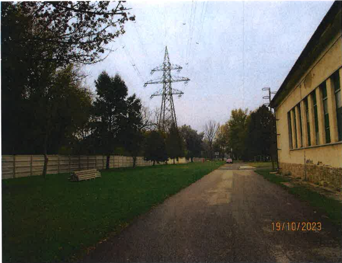
5. ábra: A Csereingatlan közepe az elektromos távvezeték alatti védőövezetben