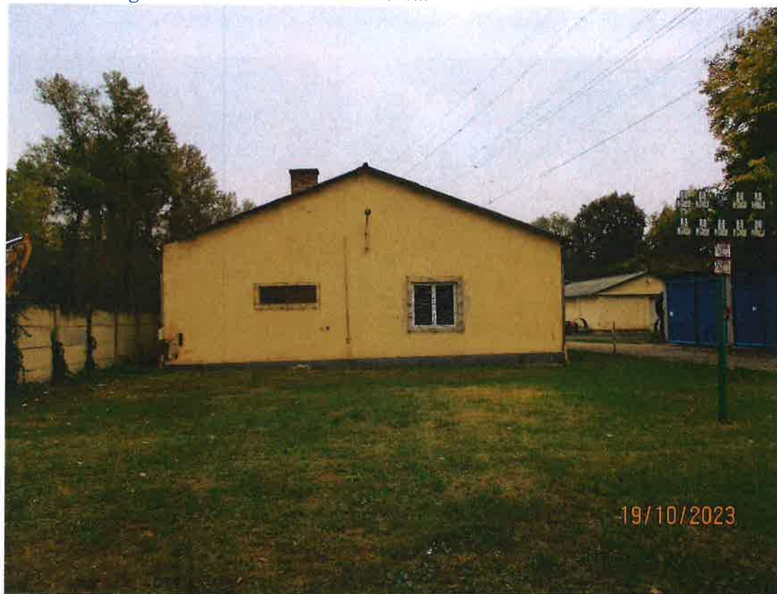
4. ábra: Az erőszármű épület az elektromos távvezeték védőövezetében a Csereingatlan déli részén