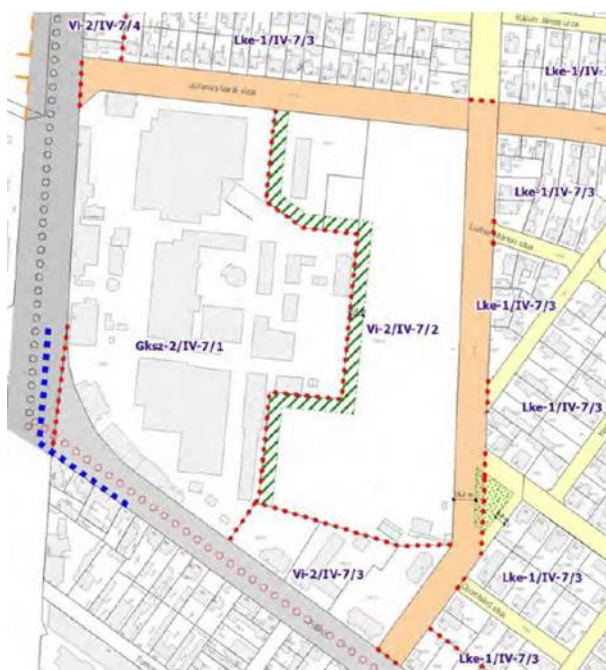
Hatályos KÉSZ részlete

A tömbön belül a Vi-2/IV-7/3 építési övezetben lévő ingatlanok átkerülnek a Vi-2/IV-7/2 építési övezetbe azzal, hogy az adott ingatlanokon ugyanazok az építési jogok, paraméterek maradnak, csak a Vi-2/IV-7/2 építési övezeten belül lesznek szabályozva. A Vi-2/IV-7/2 építési övezet előírásai az eredeti területre vonatkozóan változatlanok maradnak.