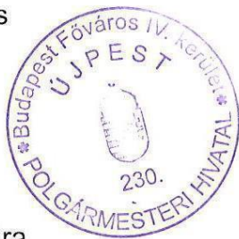
Szabó Petra a Bizottság titkára