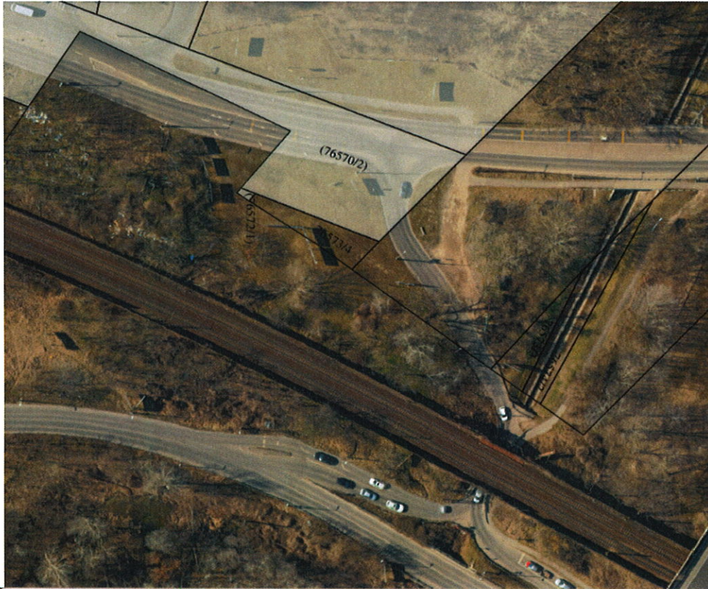
1. ábra Csomópont átépítés előtti állapot légi felvételen

Az engedélyes Dunakeszi Város Önkormányzata, akinek a forgalomba helyezés érdekében is el kell járnia, ezért saját döntése eredményeként a teljes beruházás kivitelezését is célszerűen egy kézben tartva, közbeszerzési eljárás eredményeként a Penta Általános Építőipari Kft.-t bízta meg a kivitelezési feladatok egészével, amely az útépitési és jelzőlámpák előkészítési munkáival 2022. augusztusi befejezése ellenére - a közvilágítási eszközök tervezésének, jóváhagyásának és megrendelésének elhúzódása folytán – várhatóan 2022. október első felére befejeződik és megkezdődik a forgalomba helyezési eljárás.