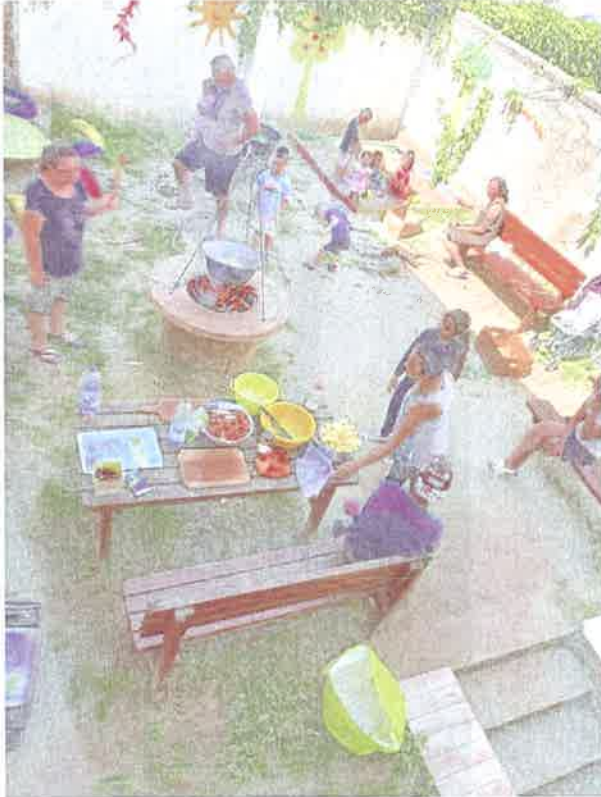
Családi nap zuglói intézményünkben

A lassan újrainduló hétköznapi élet – még ha nem is a járvány előtti időket idézve, de - visszahozta mindennapjainkba a megszokott, apró örömeket is. Meg tudtuk tartani intézményi szokásainkat, rendezvényeinket, és volt lehetőségünk arra, hogy külső partnereket fogadjunk, akik önkéntes munkájukkal segítették szervezetünket. Tartottunk családi napokat, ahol együtt bográcsoztunk, farsangot, őszi köszöntőt, anyák napját - minden olyan alkalmat, ami színesíti, vidámmá teszi az otthonban töltött időt.