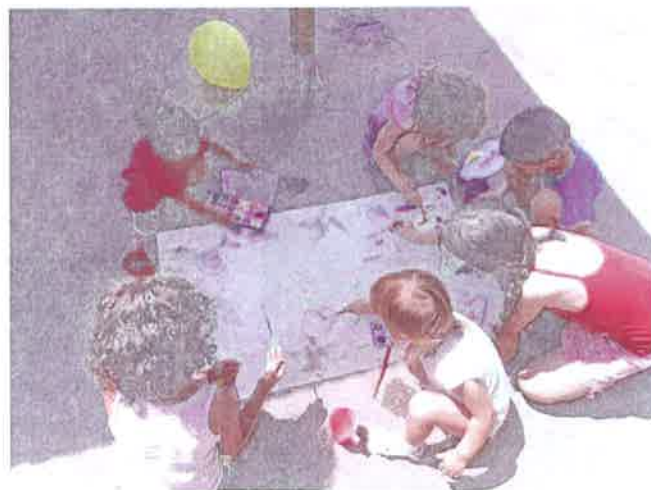
Egy nagy papír és sok-sok színes filc, festék az apró kezekben