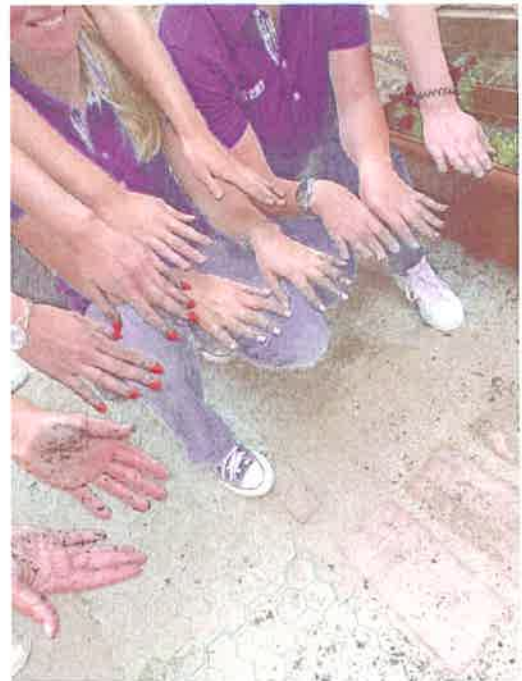
Önkénteseink virágültetés után