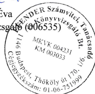
Flender Éva kamarai tag könyvvizsgáló