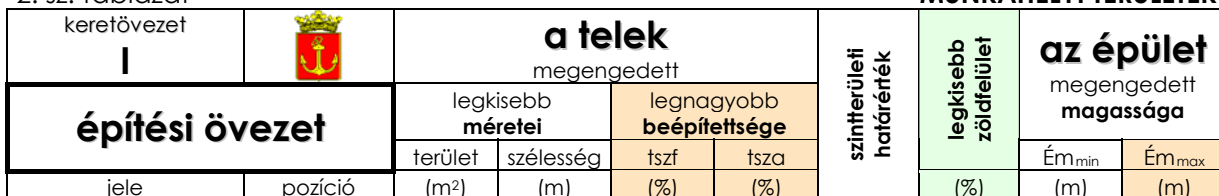
KSZT (I –intézményterület)