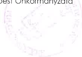
Déri Tibor polgármester Budapest Főváros IV. kerület Újpest Önkormányzata