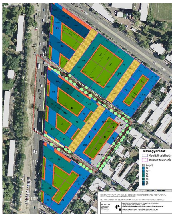
a tanulmányterv kivonata

Az Étv. 9. § (2) bekezdésében foglaltak szerint előzetesen tájékoztattuk a lakosságot a terv készítésének tényéről, a tervezéssel érintett terület lehatárolásáról, a tanulmánytervben szereplő koncepció szerint várható tartalmáról és hatásairól, egyben lefolytattuk a KSZT u. „első körös” állam-