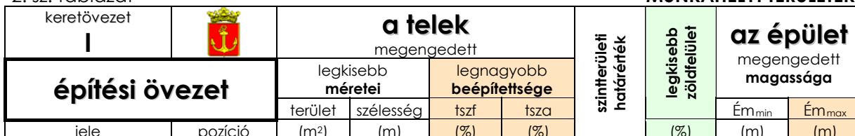
KSZT (I –intézményterület)