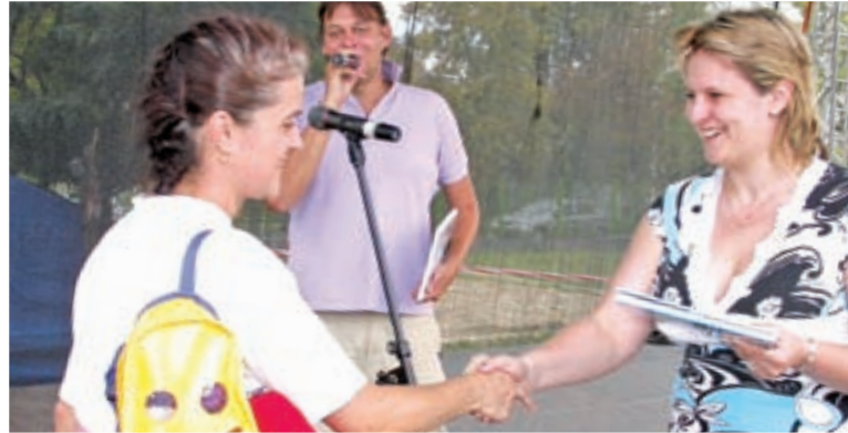
Tavalyi emlék: egy „sportos” díjazott...