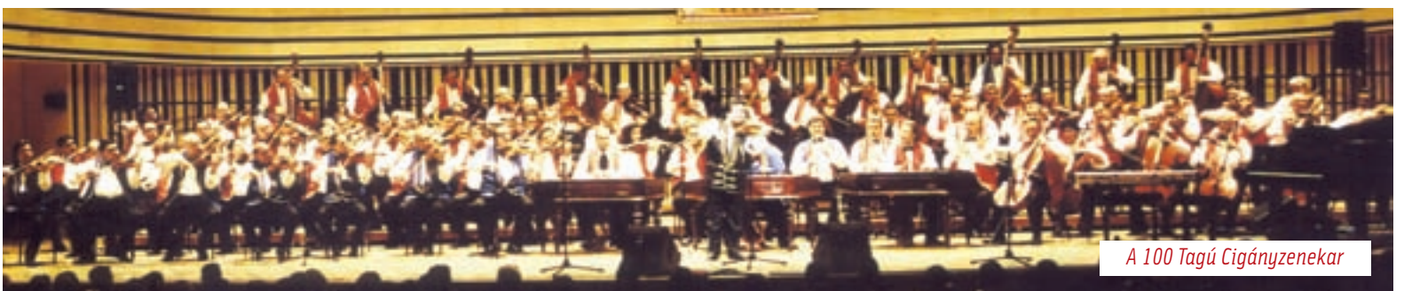
A 100 Tagú Cigányzenekar